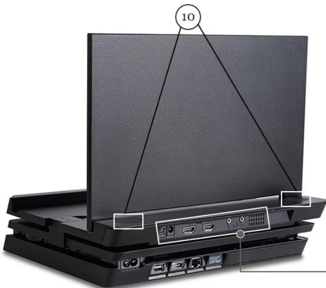
GS116SR - 背面功能部分