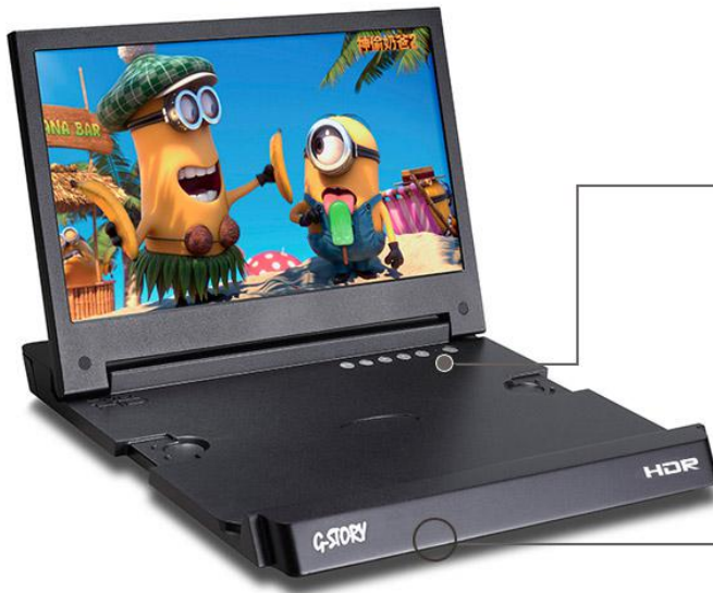
GS116SR - 正面功能部分